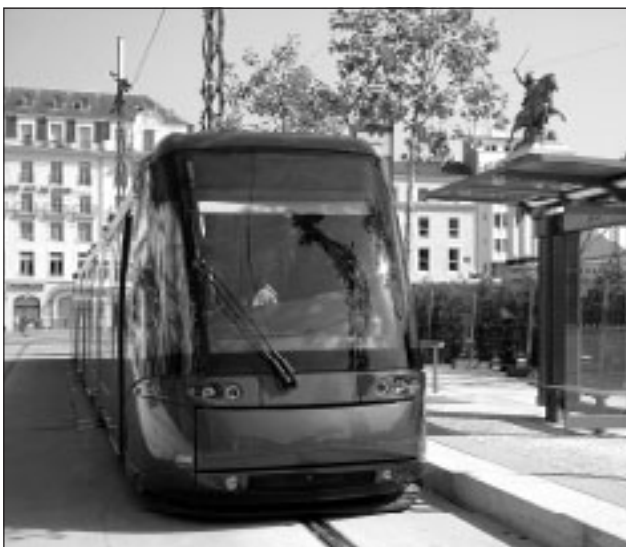
La metrolibera Translhor in funzione a Padova

Avrà un impatto troppo forte, la città deve discutere